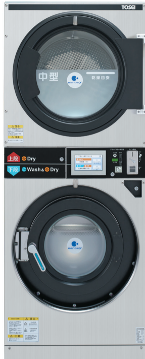
▶上段が乾燥機、下段が洗濯乾燥機の「スタックコンボ」。写真のステンレスモデルとホワイトモデルのラインナップ

これからのランドリーは「スペパ」！(株)TOSEEI(東京本店・東京都品川区)は、2月12日(木)～14日(土)に東京ビッグサイトで行われる「第10回国際コインランドリーEXPO 2026」に出展し、「世界初」というランドリーマシンを提案する。 その新製品「スタックコンボ(ST-155W)」は、洗濯乾燥機+乾燥機の2段式。これまでにランドリーマシンでは、乾燥機+乾燥機や洗濯機+乾燥機の2段式は存在するが、洗濯乾燥機+乾燥機の組み合わせは初めてだという。 11kg洗濯乾燥機1台分のスペースで11kg洗濯乾燥機と14kg乾燥機2台分の働きをすることから、「スペパ=空間効率」はバッゲンと同社。 具体例として、「従来型」の7.5坪の都市型ランドリーでは洗濯乾燥機のSが2台、Mが2台に2段式乾燥機2台の8ドラムで1か月の売上想定が52万円