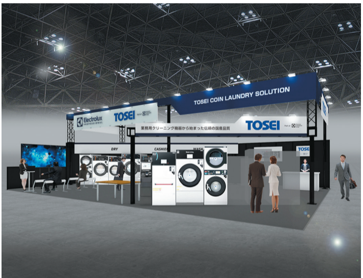
▲コインEXPOのTOSEEIブースのイメージ

また、1㎡当たりの生産性の単純比較でも、洗濯乾燥機のSは10万円前後、乾燥機のMは4万円前後なのに対し、スタックコンボでは14万円前後を想定。ボックス型店舗への展開や狭小スペースでも高稼働で高い売上が期待できることに加え、今までの物件選びの幅が広がるのも大きなメリットとなる。