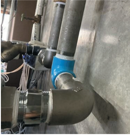
▲水洗機への設置事例(32A)

「ナノバブル発生器」新発売 アトミット 20Aと32Aの 2種類を用意 クリーニング資材の総 合商社の(株)アトミット (埼玉県三郷市)では近 年、様々な業界で注目を 集めている「ナノバブル 洗浄」を行うための『業 務用発生器』の提案を、 クリーニングやコインラ ンドリーなどに向けてス タートさせた。 ナノバブルは、「洗剤 の洗浄成分(界面活性剤) の効果を高めるチカラ」 と「繊維の奥にしっかりと 浸透して汚れを落としや すくするチカラ」がある とされており、飲食関 係や美容院、農業などで も続々と採用が広がって いるという。