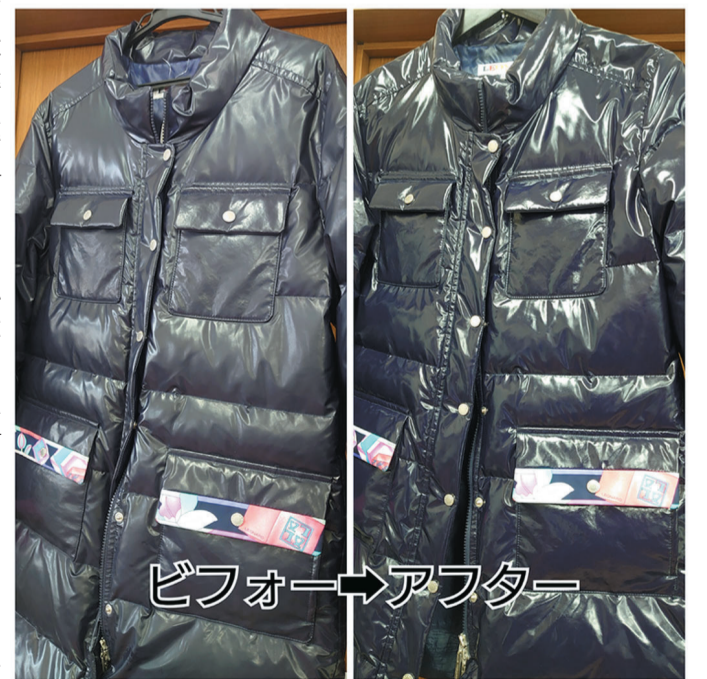
ビフォー→アフター

メンテナンスが難しい、普及しない理由について、ほとんどの人は革の選別ができないから。一般の人はもちろん、プロでも難しいと言われていた。PU&リアルレザー加工液は、素材には扱いやすい。さらに、資材メーカーは各単用に資材を作っているため、本格的に行おうとすると、たくさんの資材を揃えなければならぬ。と、とにかく難しく、費用もかかる。だから、レザーメンテナンスは普及しなかったと高柳氏は分析する。