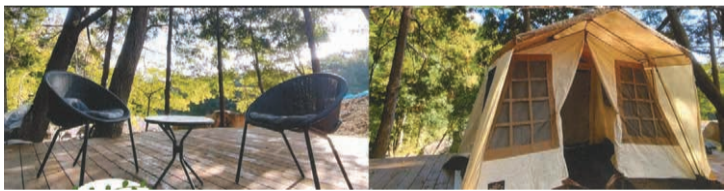
▲業界人が始めた新たなビジネスの一例

研修会終了後は懇親会で、参加費用は15,000円。詳しくは、事務局(TEL 03・5295・0136)まで。