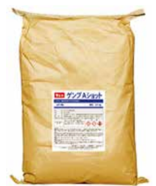
▲ 衿・袖汚れにさらに効く「ゲンブAシヨット」

また、これからの季節 に最適なのが、ランドリ ー用ワンシヨット粉末洗 剤の「ゲンブAシヨット」。 同社では、「衿・袖 汚れにさらに効く洗剤 で、夏でも頑張るサラリ ーマンをキレイなシャツ 後にさわやかな香り、▽