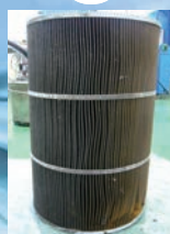
フィルター長寿命 470W後