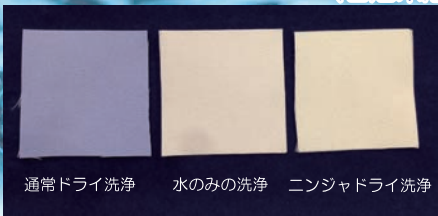
ウェット並みの洗浄力! (水溶性洗浄試験布にて)