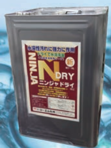
ニンジャドライ NET18L缶