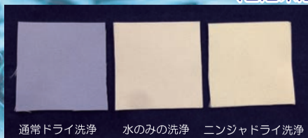
通常ドライ洗浄 水のみ洗浄 ニンジャドライ洗浄 ウェット並みの洗浄力!(水溶性洗浄試験布にて)