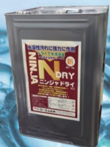
ニンジャドライ NET18L缶