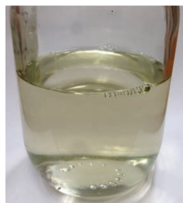
▲470W 洗浄後の溶剤は、脂肪酸等の酸価臭もなく透明度がある

この他、▽イオン性が無い(ノニオン)ので、どんなドライソープとも併用可能、▽汚れが落ちても溶剤が汚れにくい(酸価が上がりにくい)、▽洗浄後、クロロゼットなどにしまった衣類に、カビの発生や変色が起こりにくい、▽静電気が起こりにくい(強力帯電防止)などが特徴となっている。