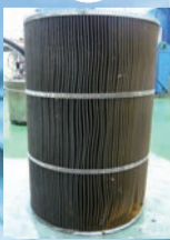
フィルター長寿命 470W後