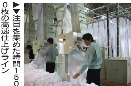
▶注目を集めた時間1500枚の高速仕上げライン

◆省エネグリーンライン 37mmから8756mmに、省エネグリーンラインでは、限られた水資源の活用や、CO 2 の削減などエネルギーを節約し、環境に配慮した「グリーンランド」システムを提案。そのラインで、発表された新製品が60kg単胴連洗「NCP60-10」。同機は、「コンパクト・節水・データ管理」をテーマに開発されたもの。従来のCP19の50kgから60kgへと生産量が20%アップしているが、新設計ボトムスクープ構造により寸法はそのまま。また、連洗と一体化させた熱交換器と連動し、品種に合わせすぎ温度「PU12」でさばき、仕果を乾燥するという。乾燥後は、カーネギツ社のピックアップ装置「PU12」でさばき、仕果を乾燥するという。乾燥後は、カーネギツ社のピックアップ装置「PU12」でさばき、仕果を乾燥するという。