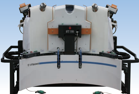
ダブルボディープレス BT-500-J

Integrated Technology for the Machine ワンランク上の美しい仕上がりで明解で使いやすい操作性を