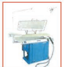
難洗！ ハイブリッドクリーナー HVC-110