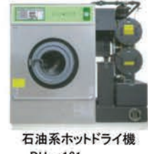
石油系ホットドライ機 DH-161