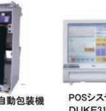
立体半全自動包装机 NC-630