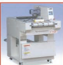
注目！ タオルフォルダー FT10F

会場：群馬県前橋市鳥羽町34-1 TEL 027-253-2215 BestClean, Best Thing. 三洋商事株式会社 電車ご利用のお客様：JR新前橋駅西口より徒歩15分 / タクシー5分 ご不明なお客様へは地図をFAXさせて頂きます。ご利用下さい。