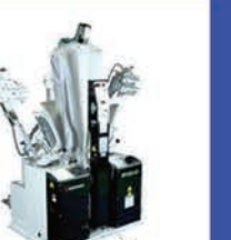
ワイシャツ仕上機 LP-550J-V2