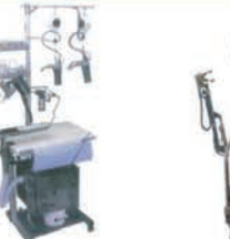
CANシステム 新型ミニフルセット